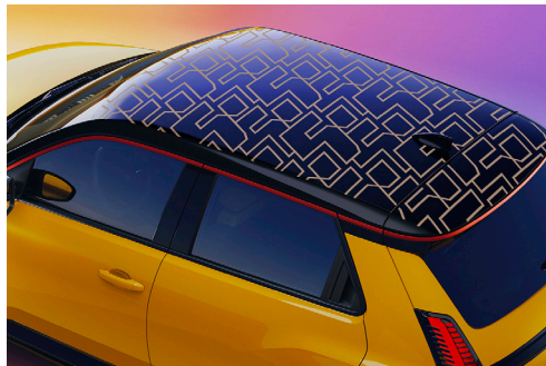
unlimited 5 kulta

Lisävarusteet saattavat korvata vakiovarusteita. Olosuhteiden vaihtelut, pakkanen, lumi, jää, sade ja muut ulkopuoliset tekijät voivat vaikuttaa auton toimintaan ja lisälaitteisiin. Esimerkiksi jäätyneet tai lumen peittämät anturi/tutka ei voi toimia ja huono keli voi häiritä järjestelmiin liittyvän kameran näkyvyyttä. Kysy lisää myyjältä.