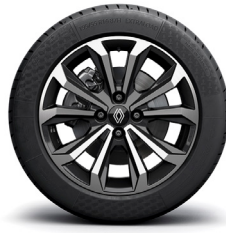
techno: 16" kevytmetallivanteet Boa Vista tummalla värikoodauksella