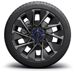
esprit Alpine: 17" kevytmetallivanteet La flèche tummalla värikoodauksella (keskiö sininen tai harmaa korivärin mukaisesti)

Katso rengastiedot osoitteesta renault.fi/rengastiedot