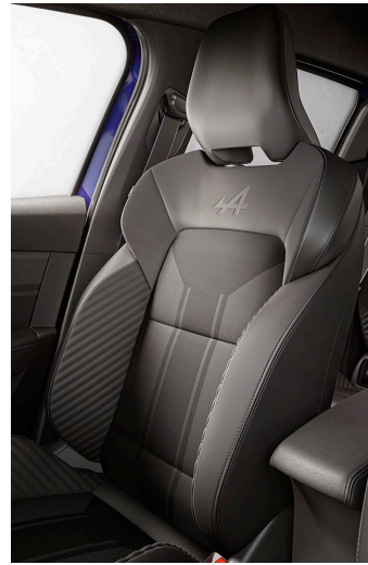
esprit Alpine: kangas-/synteettinen nahkaverhoilu esprit Alpine yksilöineillä

Kuvien autot erikoisvarustein. Lisävarusteet saattavat korvata vakiovarusteita. Todellinen CO2-arvo on autoyksilökohtainen ja saattaa vaihdella. Kaupan kohteena olevan autoyksilön vaatimuksenmukaisuustodistuksen CO2-arvo määrittää lopullisen autoveron määrän sekä kokonaishinnan. Ilmoitetut kulutus ja CO2- arvot ovat WLTP-testistandardin mukaisen laboratoriotestin mukaisia tuloksia ilman lisävarusteita. Olosuhteiden vaihtelut, pakkasena, lumi, jää, sade ja muut ulkopuoliset tekijät voivat vaikuttaa auton toimintaan ja lisälaitteisiin. Esimerkiksi jäätynyt tai lumen peittämä anturi/tutka ei voi toimia ja huono keli voi häiritä järjestelmiin liittyvän kameran näkyvyyttä.