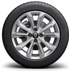
evolution lisävaruste: 16" kevytmetallivanteet Boa Vista (yksiväriset)