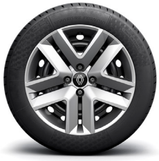
evolution: 16" muotovanteet Amicitia