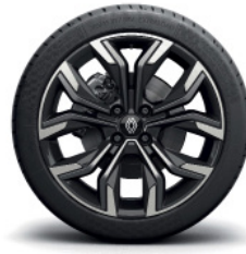
techno lisävaruste: 17" kevytmetallivanteet Monastella