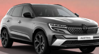
RENAULT AUSTRAL E-TECH FULL HYBRID