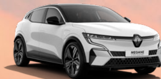
RENAULT MEGANE E-TECH ELECTRIC