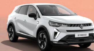
RENAULT SYMBIOZ E-TECH FULL HYBRID