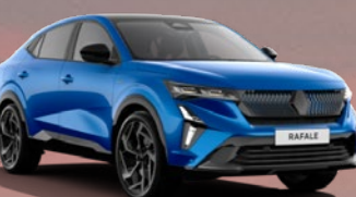
RENAULT RAFALE E-TECH PLUG-IN HYBRID