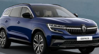
RENAULT ESPACE E-TECH FULL HYBRID