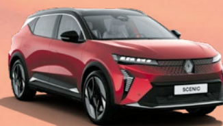
RENAULT SCENIC E-TECH ELECTRIC